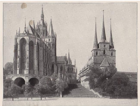
Dom um 1900

https://www.leichter-reisen.info/fileadmin/_processed_/3/1/csm_1393_DomundSeveri_2f2cf55190.jpg